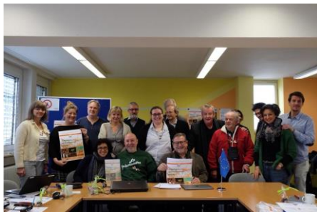
Tübingen, Tyskland, 22. marts 2018

Under dette motto afholdt partnerne i projektet Embrace, i marts 2018 et internationalt møde i Tübingen i Tyskland og inviterede lærlinge, karriere konsulenter, undervisere, eksperter, praktikanter, trænere, flygtninge og frivillige til at diskutere og dele ideer om integration af indvandrere på arbejdsmarkedet samt at præsentere projektets første produkt, et katalog der beskriver behovene, profilerne og de professionelle færdigheder i landbrugsfødevarerindustrien.