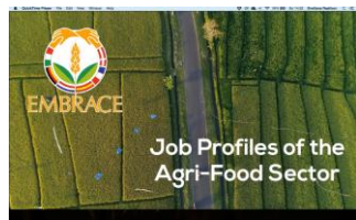
Job profiler for landbrugsfødevarer sektoren, på engelsk.